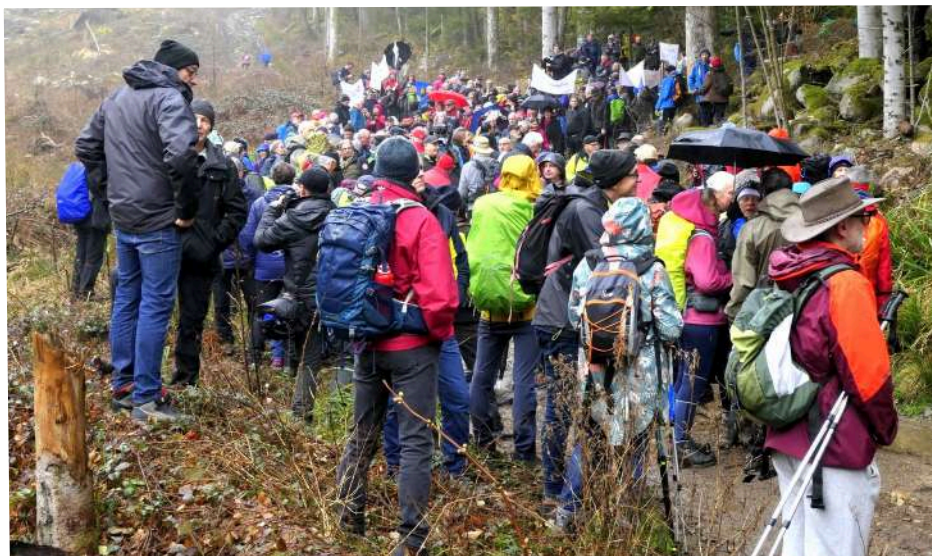
1300 manifestants le 17 février

interprétation poussée à l'extrême de cette loi a conduit un grand propriétaire forestier près de Rimbach-Masevaux à fermer complètement le sentier de randonnée qui conduit au Neuweiher, d'où d'importantes manifestations les 11 février (500 participants) et le 17 février (1300 manifestants pacifiques) pour inciter les élus à modifier la loi de façon à conserver les sentiers de randonnée existants.