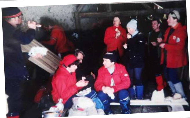
1982, casse-croûte dans une grange du Haut Doubs