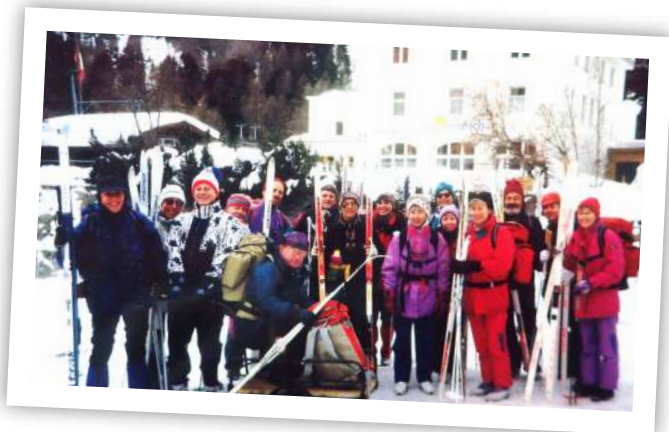
1996, à presque 2000m dans l'Engadine (Suisse)

2004-2024, c'est donc un autre anniversaire que nous avons fêté cette année avec notre excellent week-end à Breitnau en janvier. ad