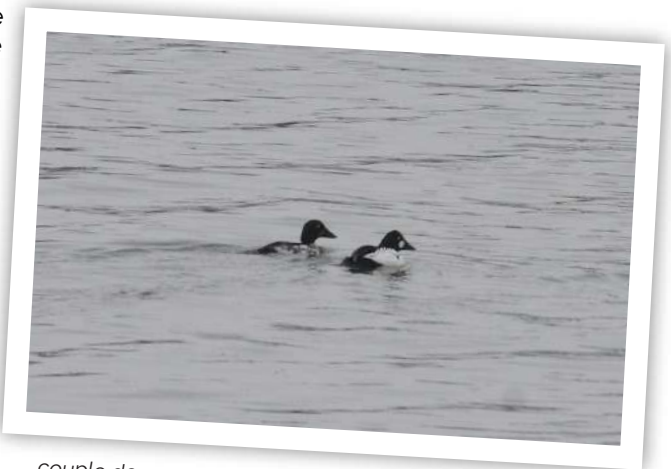
couple de rares garrots à œil d'or!

Amphibiens, oiseaux, reptiles, mammifères y trouvent refuge, et la flore se développe. C'est dans ce nouvel