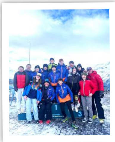
les jeunes de la mutualisation à Val Cenis