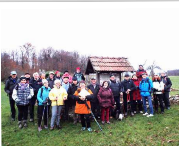
devant le vignoble conservatoire

guerre. Il faut dire qu'ici la forêt est grande et offrait un abri bienvenu à la troupe. Évitant un tronçon trop boueux du Sentier de la Mémoire, nous marchons sur des chemins bien entretenus et arrivons à un fortin, un des rares vestiges français. La guide nous montre combien les cimes de certains hêtres sont morts, attaqués par la maladie. En dernier, nous entrons dans un très grand verger au bord du village de Gildwiller. Là, à côté de dizaines d'arbres fruitiers, s'étire un petit vignoble