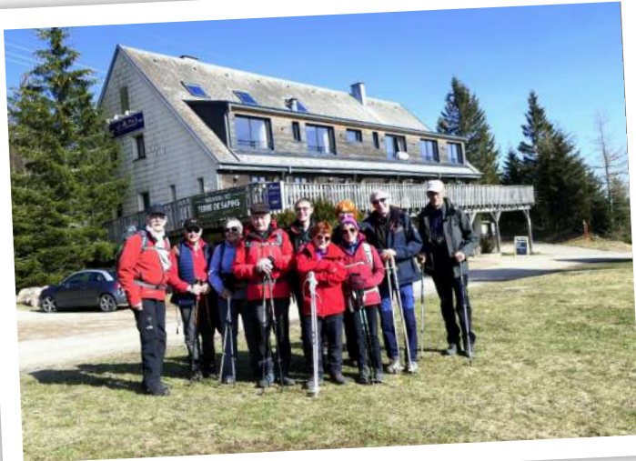
au gîte de Blancrupt

( 13 k m s pour 380m de D+), paysages variés, ambiance détendue et flâneuse. Merci à tous. fh