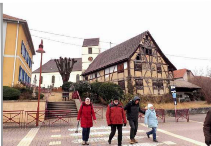
église et vieille maison à Schlierbach

maisons Renaissance, tout comme la fontaine de 1661 au centre de cet ancien chef-lieu d'arrondissement. Alors qu'il se met à neiger, le retour commence dans les champs avant de traverser les maisons et petits immeubles du grand lotissement Chalendon de Landser. Il ne nous reste plus qu'à revenir tranquillement à la mairie de Dietwiller. Le chemin est certes plat et tranquille, mais les flaques d'eau gelées réservent plusieurs glissades et chutes heureusement bénignes. Intéressante balade hivernale (8,6 km, 120m de montées), et nous n'avons même pas trop