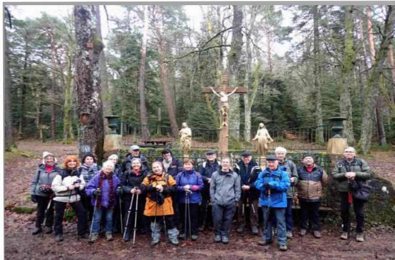
Bildstoekle au-dessus de Guebwiller

plaine de mystères et d'ondes telluriques nous accueille. Un peu plus loin nous sommes à la recherche d'un menhir signalé sur la carte et que connaît Chantal, la régionale de l'étape. Cette massive pierre d'1,40m de haut, située sur la limite intercommunale, porte sur