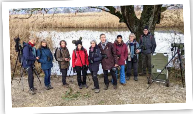
plein d'observations au Klingnauer Stausee

Météo clémente annoncée par la station météo suisse Landi pour Klingnau, alors qu'il pleut sur Mulhouse à 6h00. Très confiants, nous voici en route pour Leuggern en Argovie pour une nouvelle journée d'observation le long de l'Aare qui prend sa source au pied de l'Aargletscher