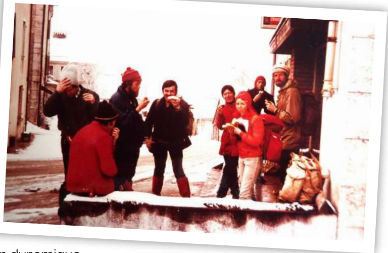
1974, arrêt petits pains à Jougne, sous le Mont d'Or

Sud, entre Menthières et les Rousses, avec hébergements improvisés en abris ou refuges. C'était dur dur mais combien stimulant ! Le déclic était donné pour de nombreux raids que nous avons organisés nous-mêmes chaque année pour nos