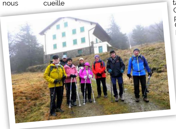
pas de lune avec le brouillard du Markstein