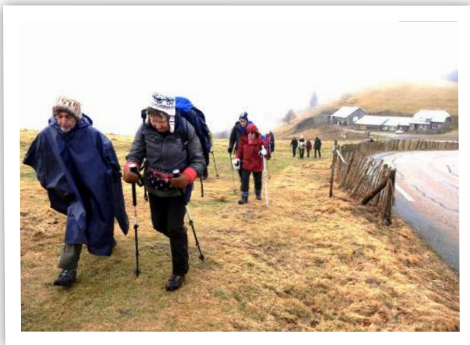
moins humide l'après-midi au col du Haag

en tous genres ainsi que le chocolat le terminent. N'en jetez plus, ça suffit. « Ah quel repas ! J'entends les joyeux souhaits d'anniversaire résonner à mes oreilles ». Dehors, photos ! souriez ! On s'en va et un peu plus loin, je m'écrie : « Mes bâtons ! »