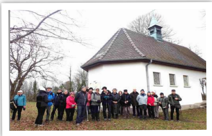
chapelle Saint Gall à Didenheim