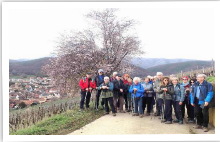
l'amandier de Soultzmatt déjà en fleurs

gagées, belles étoiles jaunes, et l'érodium, petit géranium rose. Toujours en chemin balcon, nous suivons le sentier viticole et le sentier des poètes pour arriver au clou du jour : l'amandier qui est bien en fleurs. Belle découverte que cet arbre solitaire qui est photographié sous toutes ses faces avec ses belles fleurs roses. Photo de groupe obligée, et on poursuit jusqu'à la table d'orientation où Edwige nous explique l'histoire de la vallée noble et les mignonnes légendes de l'amandier.