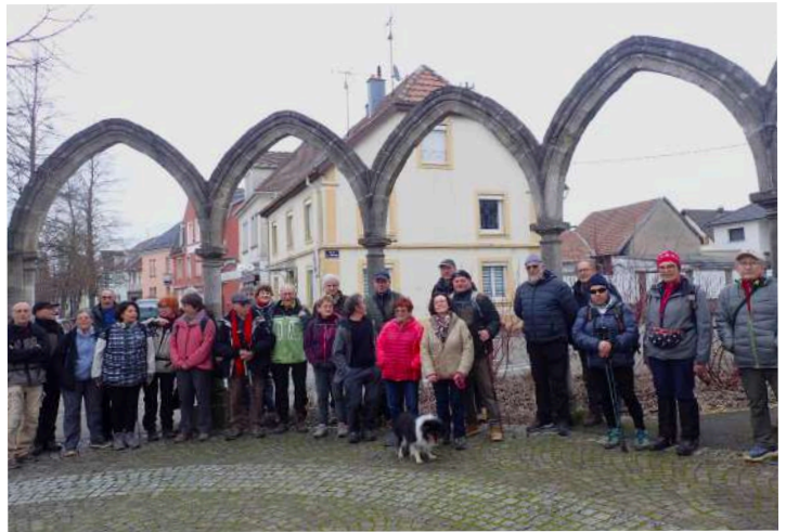
vestiges devant l'église de Sausheim

érigé de nombreuses bornes explicatives comme l'emplacement d'un ballon militaire captif en 1939, le forage en 1906 à la recherche de potasse, la présence de multiples bistrotts ou encore un cabaret qui en 1900 faisait venir en direct des sardines du Havre. Mais le clou a été la vue de l'obélisque géodésique de 1804, construite sous Napoléon pour servir, avec son homologue à 19km au Nord, de base à « l'élaboration de la carte de l'Hélvétie et à la détermination de la grandeur de la Terre ». Bref, plein de réminiscences historiques qui font le plaisir du promeneur un tant soit peu curieux. Belle après-midi donc avec une température agréable (12°) et une arrivée