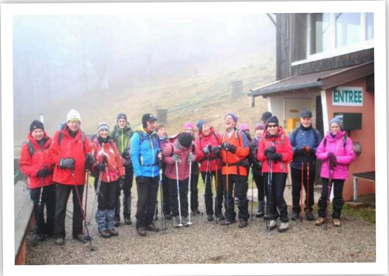
devant le refuge des AN du Treh