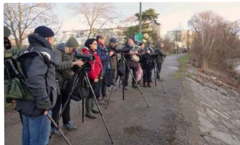
à l'affût du très coloré martin-pêcheur