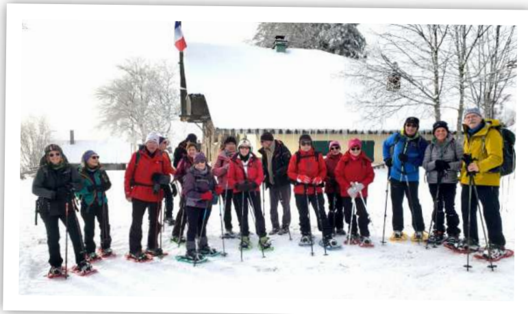
pause au refuge du SCV Thann

sentier très emprunté, par endroits verglacé. Petite pause à la sortie de la forêt avant de poursuivre un peu plus pentu. Nouveau constat, à partir de l'altitude 900m il y a une vingtaine de cm supplémentaires par rapport à la reconnaissance dimanche, nous décidons de chausser les raquettes, presque une première début décembre