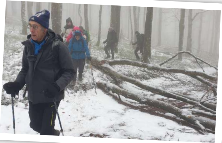
neige fraîche sur le Breitfirst et le Lauchenkopf

hauteur du chalet Widenbach. Fin de circuit vallonné pour rejoindre la station du Schnepfenried presque désertée. Le chalet des AN Colmar est situé en contrebas et nous sommes attendus. Chacun trouvant