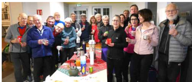
fête de St Nicolas