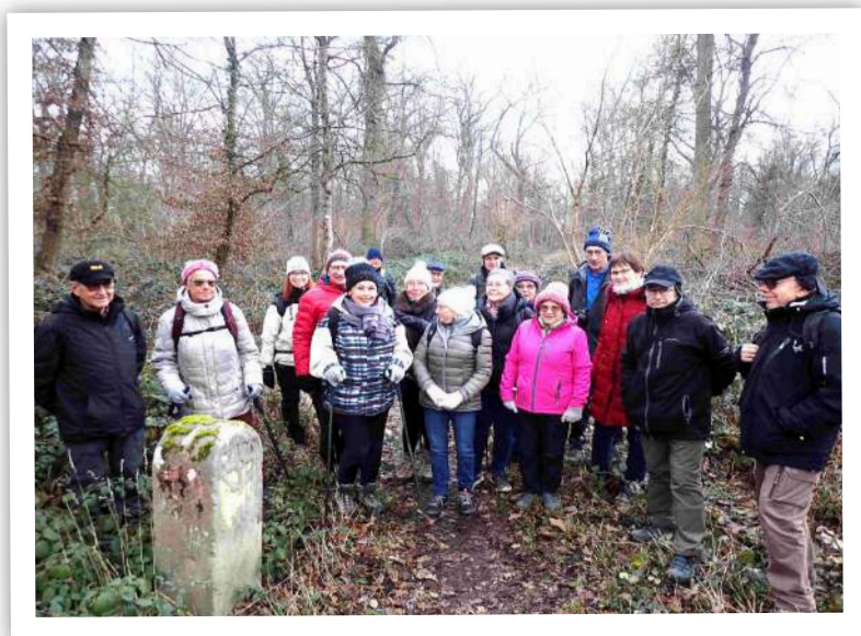
devant la borne de Mulhouse de 1760

lotissement SNCF de 1947 puis le récent ensemble immobilier Aviatik, du nom de cette usine des premiers avions pionniers (1909 à 1914) qui se situait ici à la Manurhin. Nous arrivons à la Doller que nous longeons sur la verte piste cyclable jusqu'à la limite d'Illzach, en passant près du nouvel Eco-quartier qui remplace l'ancienne cité Brossolette. Après la traversée d'un premier petit bois, arrivée près du Cimetière Nord où les tombes sont encore bien fleuries. Un 2 e bois nous fait découvrir une ancienne borne (1760) de la République de Mulhouse, à la limite de Kingersheim. Après la station Tram les Châtaigners, nouvelle forêt où la « promenade verte » de Kingersheim nous fait longer le Dollerbaechlein. Là c'est bucolique et inattendu si près de Mulhouse. De retour dans les rues de