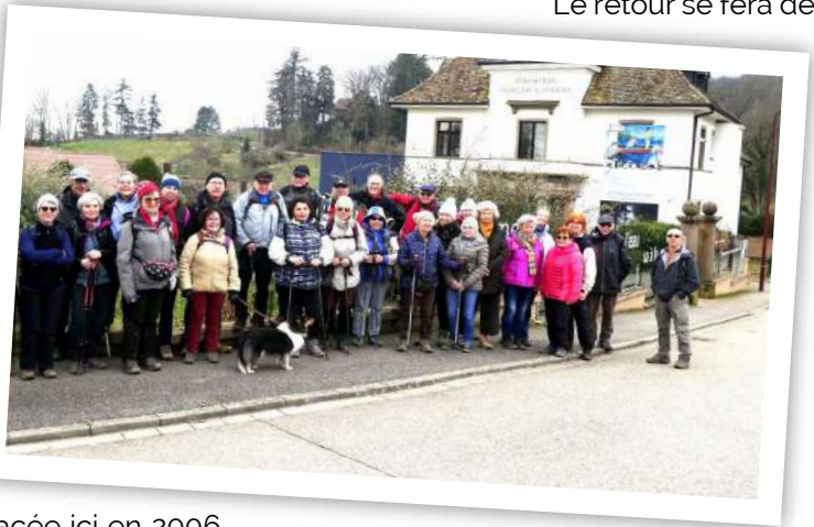
devant la fondation Schneider à Wattwiller