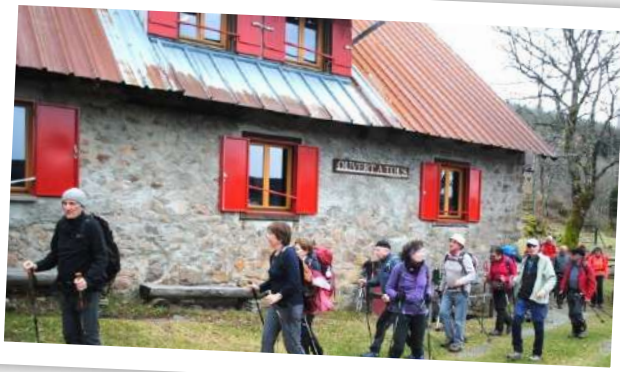
départ du refuge Isenbach après le casse-croûte