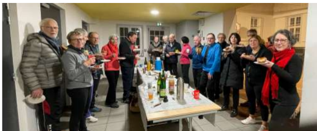
la galette des Rois