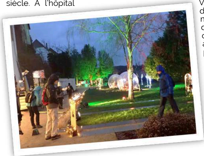
un coin de la Forêt Enchantée

St Morand, le cimetière retient notre attention avec son monument commémorant la guerre de 1870. Puis l'ancien portail de l'hôpital nous révèle que celui-ci a été construit en 1752 dans les bâtiments de l'ancien prieuré. Nous gravissons un chemin forestier où les dernières couleurs d'automne seraient à la fête avec un rayon de soleil, mais aujourd'hui la tendance est à la grisaille. En sortant de la forêt sur le haut de la colline c'est même un petit crachin qui nous accueille. Revenant vers Altkirch par la bourgeoise colline du Roggenberg, nous plongeons vers le centre-ville en admirant l'uniformité des toits du vieux bourg. Dans les rues illuminées c'est d'abord la découverte des maisons anciennes avec tourelles et oriels. Vient le clou de la sortie, la féerie de la Forêt Enchantée que la nuit met en lumière. Vraiment un plaisir des yeux, cette évocation des contes et légendes sundgaviens à travers des décors, personnages et animaux magiquement éclairés. Nous déambulons avec grand plaisir dans ces cheminements surnaturels, avant de conclure par un très joli bioptique sur la façade de l'église. Merci à nos guides pour cet enchantement qui a fait oublier l'humidité et le froid. ad