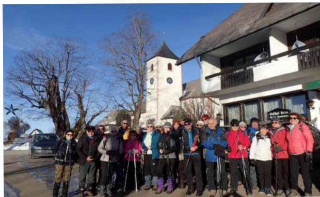
devant l'hôtel à Breitnau

Après 3 ans d'interruption suite au Covid,