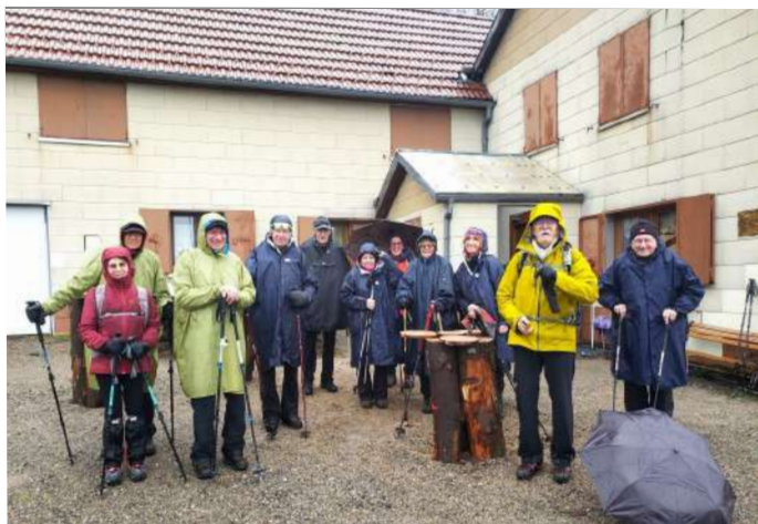
ça mouille au refuge du Ski Club Kruth