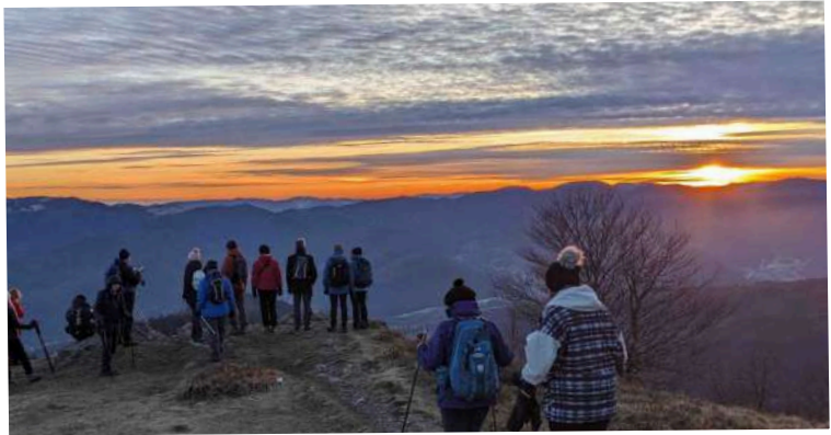
magnifique coucher de soleil samedi soir

Marie est venue étoffer l'équipe en ce dimanche matin. Les randonnées se sont déroulées sous des températures dignes d'un mois de mars. Après cette agréable promenade de 8km avec toujours la chaîne des Alpes bernoises nettement visible, nous passons à table et nous