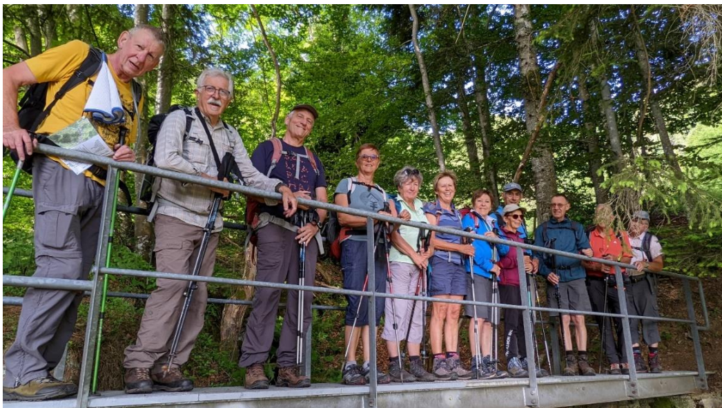
2 juin, au-dessus de la cascade du Gazon Vert