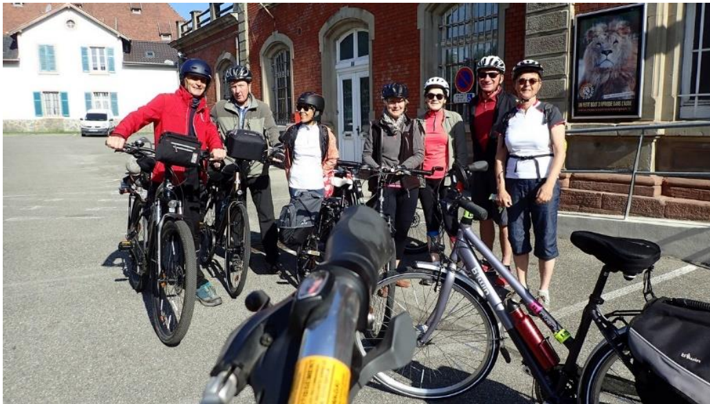
8 mai, la petite troupe démarre à la gare de Thann