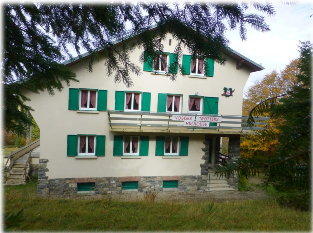
Chalet du Markstein – Altitude 1160 m Juin

Siège social : 81 rue de Hartmannswiller 68200 MULHOUSE