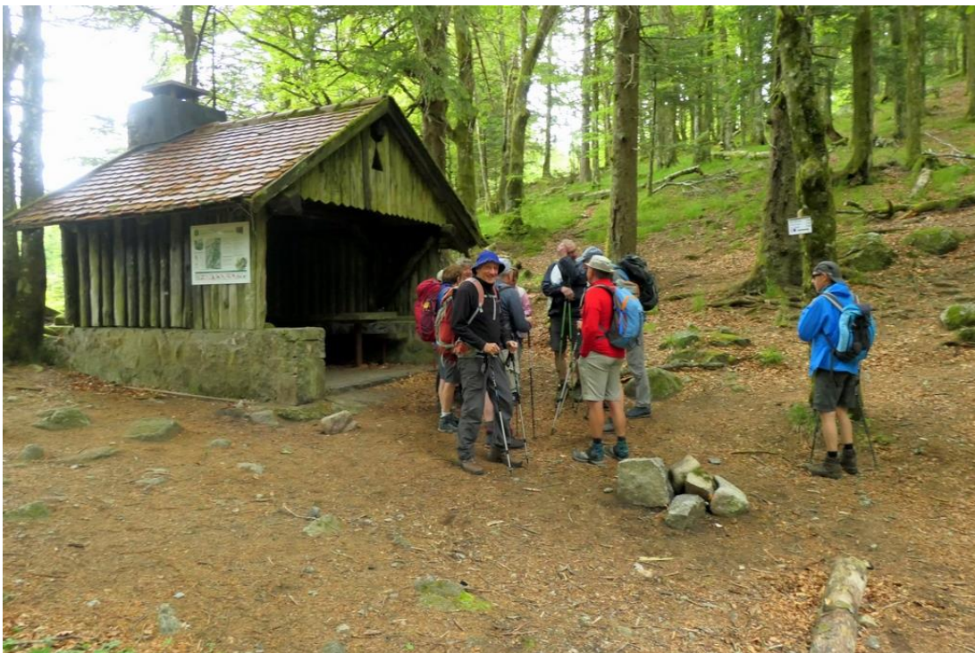
26 mai, l'abri du Vintergès dans le massif du Ventron