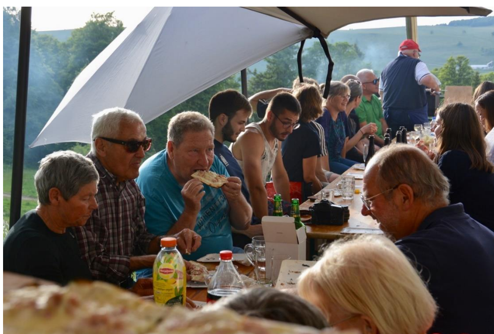
4 juin, une cinquantaine de membres et d'amis à la soirée tartes flambées sur la terrasse du chalet