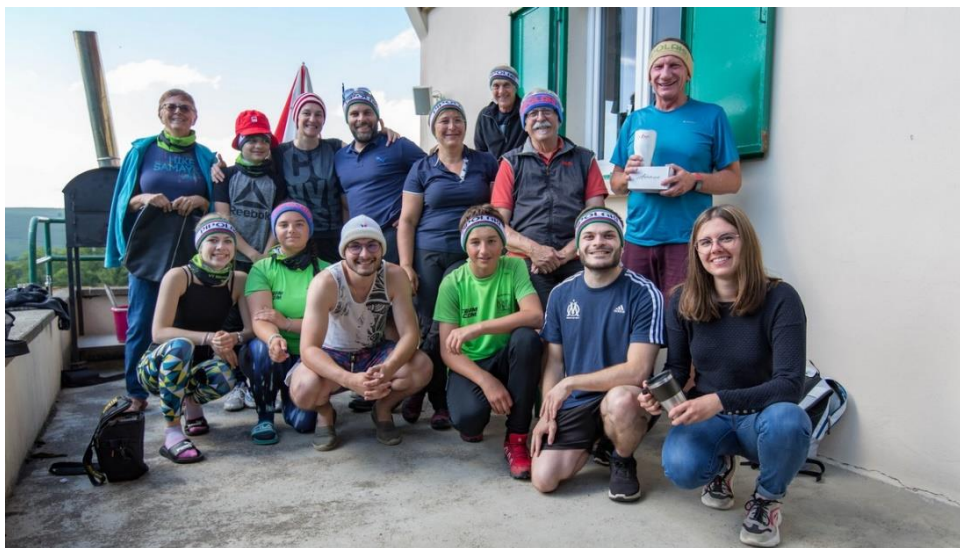
4 juin, les joyeux participants à l'exercice d'orientation