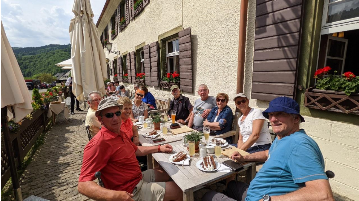
12 mai, le plaisir du traditionnel Caffee-Kuchen en Forêt Noire

bulbe de Sankt Ulrich avant de remonter par un long chemin carrossable vers Kohlerhof (auberge). Nous sommes tentés par un Café-Kuchen mais préférons poursuivre en direction de la crête pour basculer à nouveau vers Spielweg et le Obermünstertal. Nous trouvons une place sur la terrasse plein sud de l'hôtel Spielweg repéré le matin, maison de qualité semble-t-il. Douceurs méritées après ce périple improvisé de 14,5 kms et de 750 m de D+. Forêt-Noire, région aux traditions immuables dont le CK, on apprécie ! fh