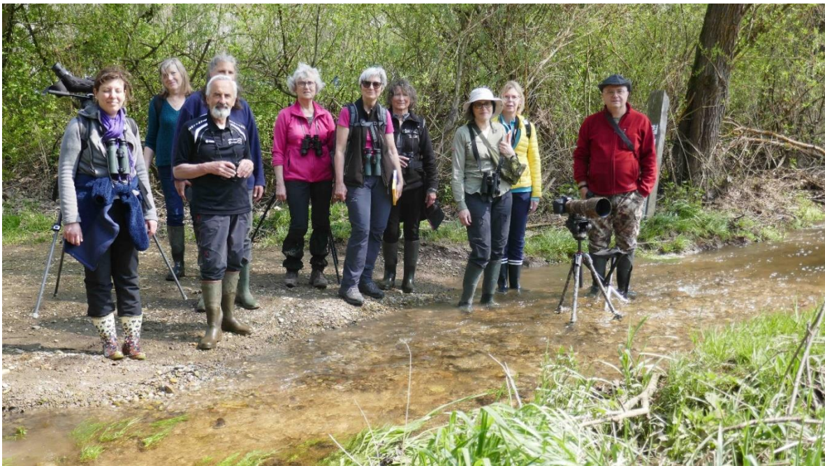
15 avril, Pas mal d'eau aux Rohrmatten près de Sélestat