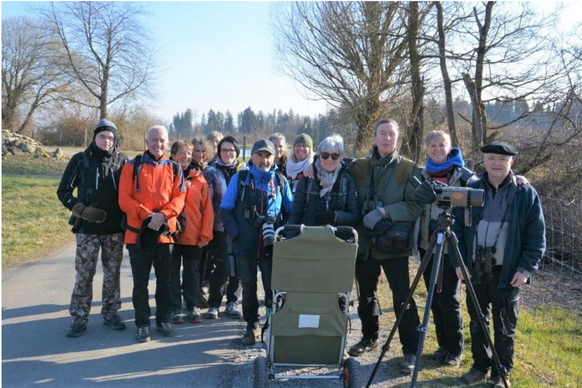
5 mars, le plein d'observations au Flachsee (Suisse)