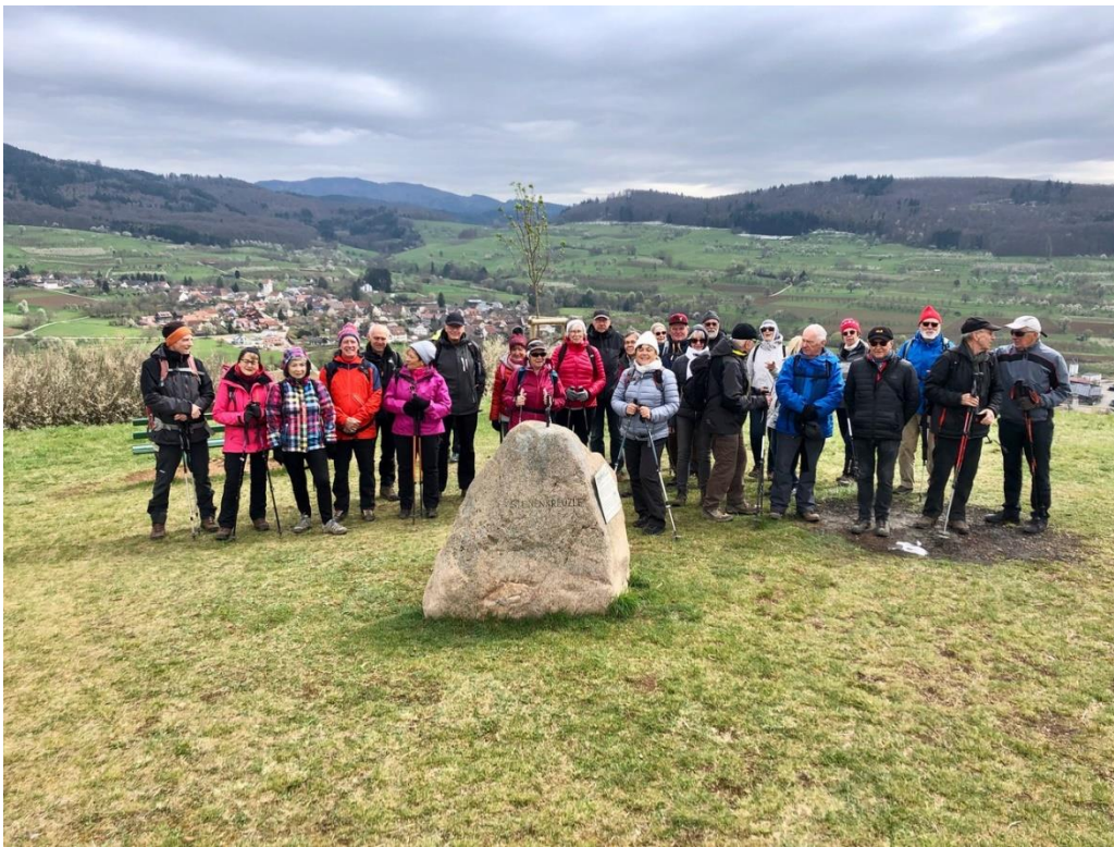
5 avril, balade des cerisiers en fleur autour de Obereggenen, pays de Bade