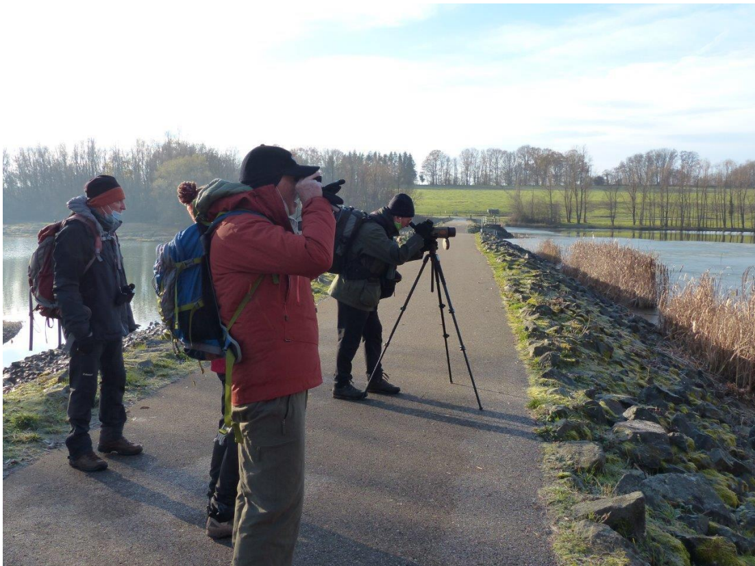
11 décembre , sur le plan d'eau de Michelbach