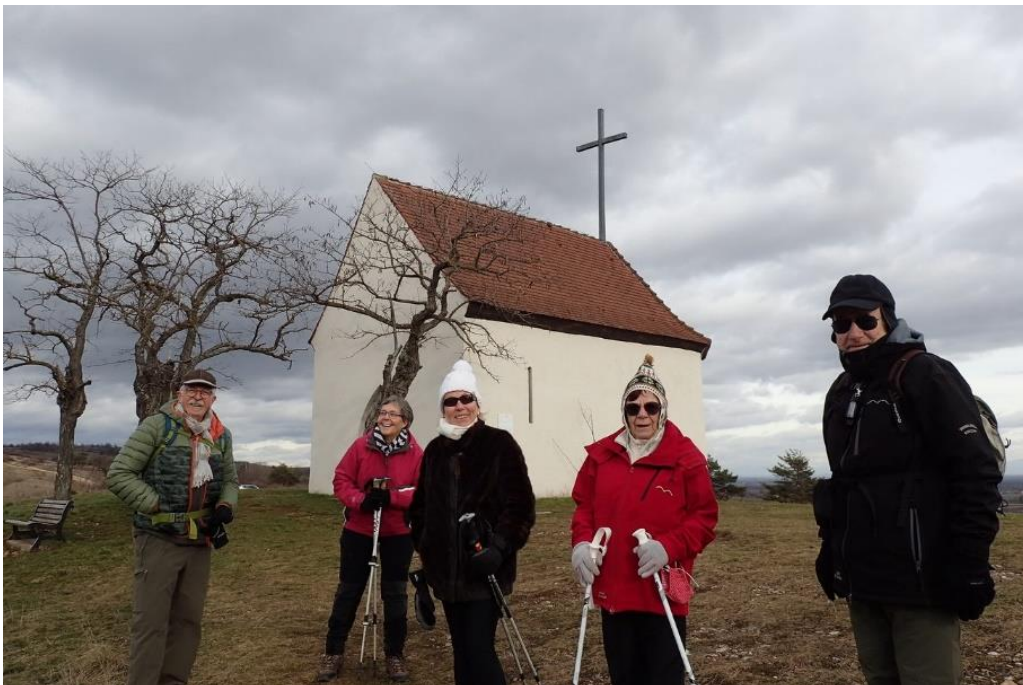
26 janvier , chapelle du Bollenberg

centenaire. Il s'agit d'une grande crèche toute en bois confectionnée en 1920 par un artiste-menuisier de Forêt Noire, suite à un vœu qu'il avait fait s'il sortait vivant de la guerre 1914-18. Après cette édifiante visite, nous admirons l'ancien château voisin et les tortueux sophoras du Japon. Puis la montée vers le Bollenberg (toujours par groupe de 6 marcheurs) nous réchauffe un peu et nous fait traverser les vignes du premier des 3 grands crus du village, le Bollenberg. Nous arrivons à la « magique » chapelle des sorcières chargée de légendes. Traversant les pelouses sèches calcaires où le printemps réserve de belles découvertes botaniques, nous apprenons qu'ici il ne pleut que 350mm d'eau par an (par comparaison 680mm à Mulhouse). Belles vues de tous côtés, soit sur la plaine, soit sur le Petit Ballon, soit sur la Vallée Noble de Soultzmatt-Westhalten. Après « l'ascension » de la colline St Blaise (364m d'altitude), point culminant de la journée, petite pause boisson dans le froid relatif (4)°. C'est ensuite la descente en direction de Soultzmatt, puis la remontée vers le Pfungstberg et le Lippelsberg, les deux autres grands crus d'Orschwihr. Et nous voilà déjà rendus à la chapelle St Wolfgang, après 6,5km et 150m de montées cumulées qui nous ont fait du bien, autant physique que pour le plaisir de se retrouver (les Ratschwag ne manquaient pas). Ad