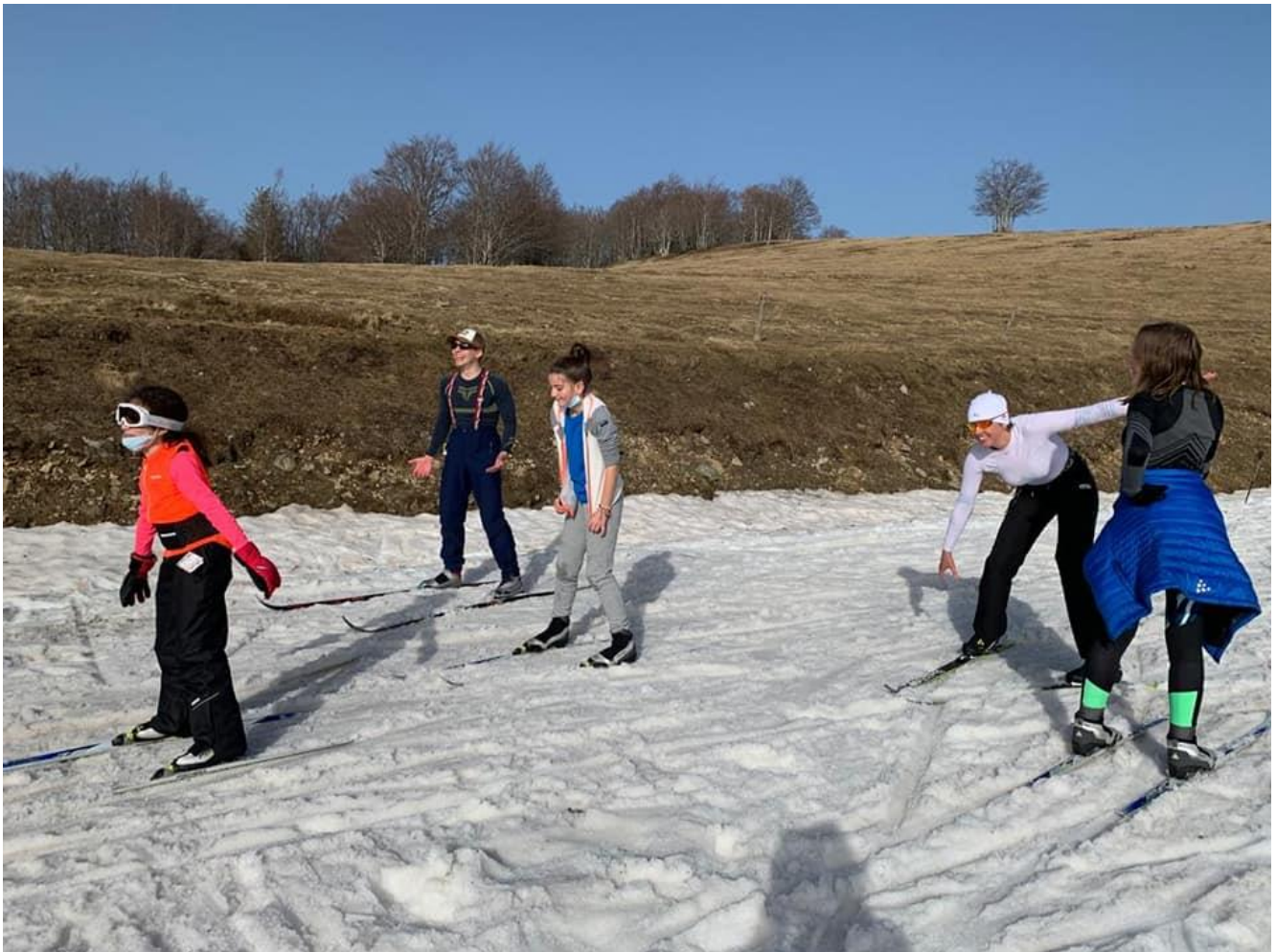
Markstein . Belle neige en janvier et soleil en février pour l'initiation au ski de fond ; super saison pour les jeunes alpins qui eux seuls avaient droit aux téléskis