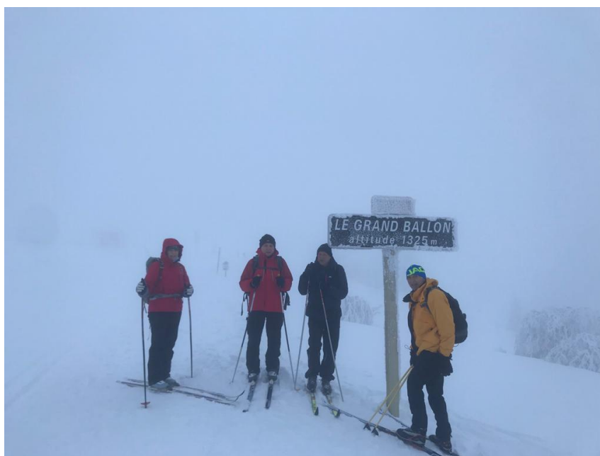
2 janvier , sur le toit des Vosges mais dans le brouillard