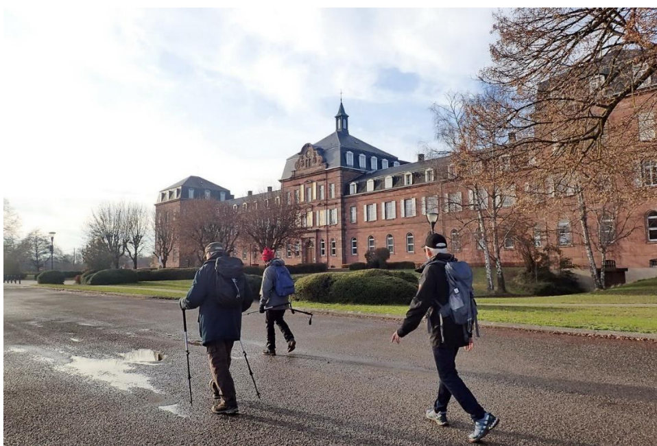
16 décembre , passage devant le collège épiscopal de Zillisheim, ancien petit séminaire datant de 1869