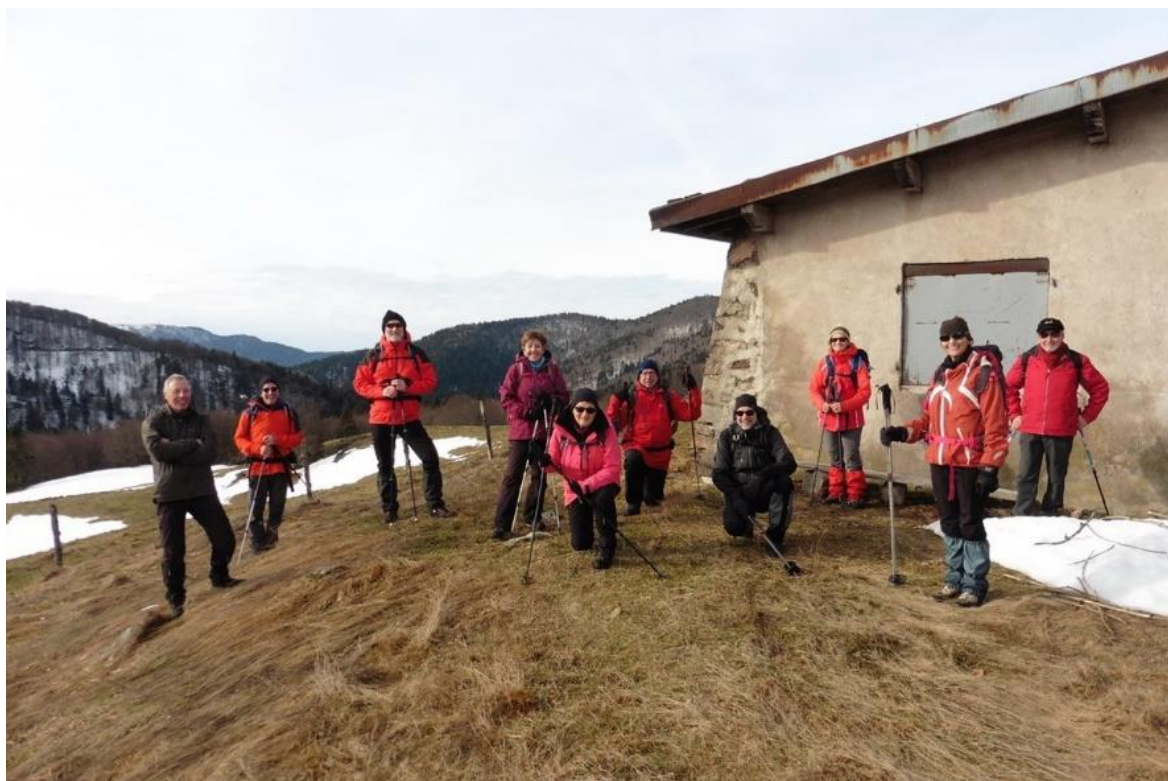
4 février , chaume de Neufbois près du Rouge Gazon