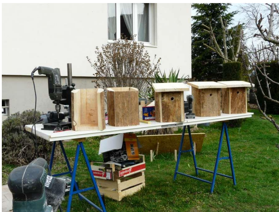
Février , fabrication de nichoirs pour les alentours du refuge du Markstein

D'autres opérations seront encore menées à bien d'ici l'été, comme l'installation d'un composteur, le nettoyage du site du Markstein, la protection de notre ressource en eau, etc