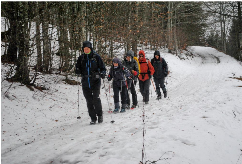
17 décembre , on randonne par groupe de 6 à cause de la pandémie