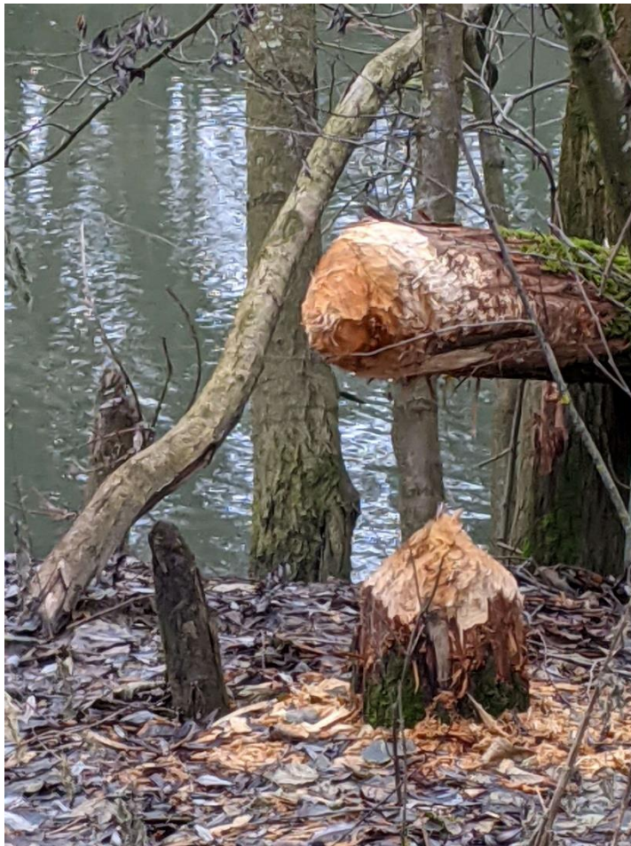
15 décembre , Illberg, un arbre coupé en pointe de crayon par les castors