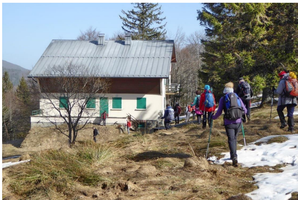
25 février , la pause s'impose sur la terrasse de notre chalet