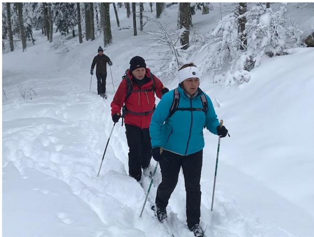
30 décembre , 1 ère neige, 1 ère sortie ski de fond à l'Oberlauchen avec la présidente