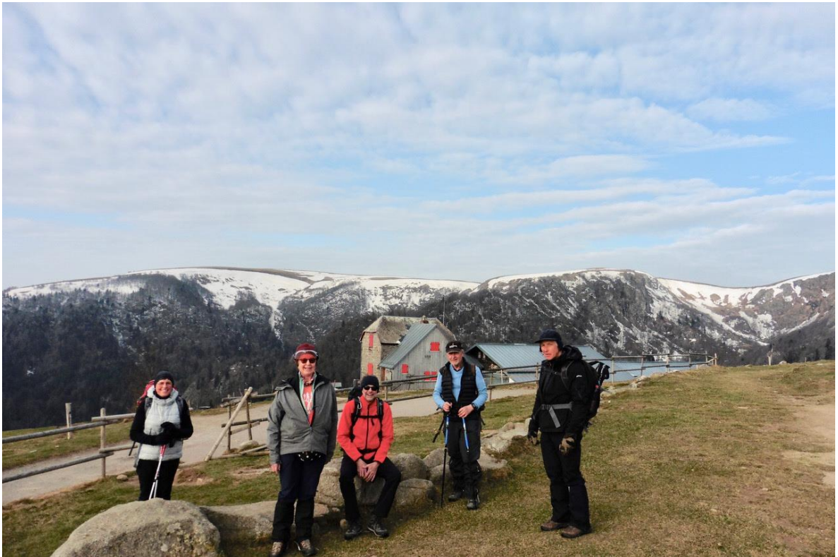
4 mars , Schiessroth, superbe panorama sur les crêtes des Hautes Vosges